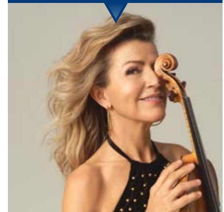
Anne-Sophie Mutter

Anne-Sophie Mutter, Royal Philharmonic Orchestra, Vasily Petrenko Pala De André, 21 maggio alle 21