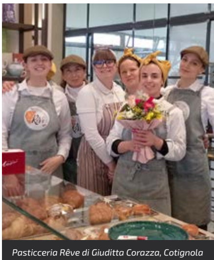
Pasticceria Rêve di Giuditta Corazza, Cotignola