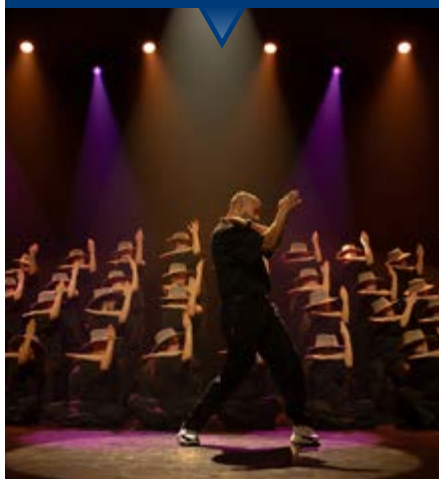
Murmuration Level 2 - © Fabien Malot

Un'attrazione fatale per le forme geometriche è stato il primo step creativo per Sadeck Berrabah, espresso in un appassionato studio del disegno. Presto è arrivata anche la danza. Ma a combinare i due amori è stato uno stormo di uccelli in volo. Murmuration , intraducibile parola inglese che indica le armoniche formazioni dei volatili, è diventato da allora il suo mantra coreografico. Come un direttore d'orchestra, l'artista francese dirige i suoi interpreti in una danza di segni e geometrie perfette, miscelando il tutto con elementi tratti dalla street dance come il tutting o le contrazioni muscolari del poping . Estasi ipnotiche di danza 2.0 capaci di esaltare un collettivo di danzatori che si muovono all'unisono anche in questo palpitante secondo capitolo di Murmuration .