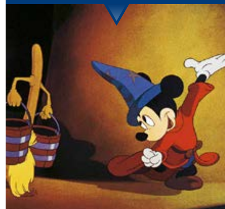
Fantasia in Concert Live to Film

Tutto cominciò a fine Anni Trenta per rilanciare la carriera di Mickey Mouse, la cui popolarità era in declino, attraverso un cortometraggio intitolato The Sorcerer's Apprentice . Finì per diventare l'esperimento più audace di Walt Disney, il visionario creativo che ha fatto la storia del cinema d'animazione e che con "Fantasia" (1940) coronò il desiderio di fondere le immagini con la musica classica. Oggi da quel rivoluzionario film e dal suo sequel "Fantasia 2000" è nato un nuovo lungometraggio. Ad accompagnarne la proiezione le musiche dal vivo eseguite dall'Orchestra Cherubini, diretta da Thiago Tiberio in brani quali la "Pastorale" di Beethoven, il Clair de lune di Debussy, La danza delle ore di Ponchielli, Pomp and Circumstance di Elgar e, ovviamente, L'apprendista stregone di Dukas.