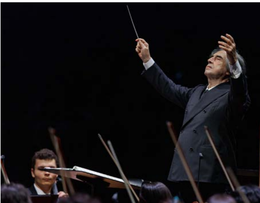
Riccardo Muti

Con il concerto inaugurale al fianco della Royal Philharmonic Orchestra guidata dal suo direttore musicale Vasily Petrenko, Anne-Sophie Mutter celebra mezzo secolo sulle scene: l'impeccabile tecnica e la profondità interpretativa coltivate nel corso di una straordinaria carriera – sin da quando Karajan la invitò, appena tredicenne, a suonare con i Berliner – faranno onore al Concerto per violino e orchestra in re maggiore op. 61 di Beethoven, che la violinista ha inciso sedicenne proprio con il leggendario mentore. Il programma si completa con la Quinta Sinfonia di Mahler, la più autobiografica, composta tra il 1901 e il 1902 sotto la luce dell'incontro con Alma Schindler: dalla fanfara iniziale all' Adagietto reso immortale dal cinema di Visconti, la Quinta è un universo di passioni contrastanti.