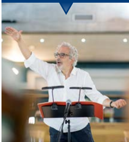
Giorgio Battistelli

Nel 1981 andava in scena a Roma Experimentum Mundi , l'opera in cui Giorgio Battistelli, Leone d'Oro alla carriera alla Biennale di Venezia, combinava quattro voci femminili, un percussionista e un attore chiamato a recitare le didascalie delle illustrazioni dell' Encyclopédie lungo i suoni di sedici artigiani di Albano Laziale che lavorano con i loro strumenti in sincronia con i tempi della partitura. Oggi il progetto è riproposto come OperaPaese per Ravenna : gli artigiani di questo territorio si mettono all'opera interagendo sul palco con i musicisti, in un gioco d'incastri timbrici e ritmici che esaltano gesti in pericolo di estinzione, testimoni di mestieri antichi, mentre Guido Barbieri dà voce a brevi narrazioni scaturite dai dialoghi con i partecipanti alla creazione collettiva.