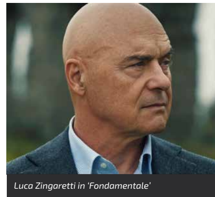
Luca Zingaretti in 'Fondamentale'

professionale. Oggi, infatti, sta vivendo una trasformazione epocale, non solo per quanto riguarda i processi produttivi e tecnologici, ma anche sotto il profilo della formazione. Un altro aspetto fondamentale che emerge dai dati riguarda il ruolo strategico nella lotta contro il cambiamento climatico. Il 69,8% degli intervistati ritiene che il settore possa contribuire in modo determinante a questa causa, riducendo l'impatto ambientale attraverso l'adozione di soluzioni eco-sostenibili come edifici a energia zero, l'uso di materiali riciclati e la progettazione di infrastrutture verdi. Numeri che indicano come gli italiani siano pronti ad abbracciare un'immagine più moderna e all'avanguardia di questo settore. La ricerca suggerisce che per migliorare la propria immagine e superare i pregiudizi che ancora lo caratterizzano, il settore delle costruzioni deve avviare un ampio processo di comunicazione e sensibilizzazione. In questo contesto, una strategia vincente sarebbe anche quella di collaborare maggiormente con gli istituti educativi, partecipare a eventi scolastici, fiere del lavoro e promuovere iniziative che possano far conoscere ai giovani le opportunità di carriera offerte dal settore. Il video è disponibile anche sul sito di Confartigianato della provincia di Ravenna www.confartigianato.ra.it ■