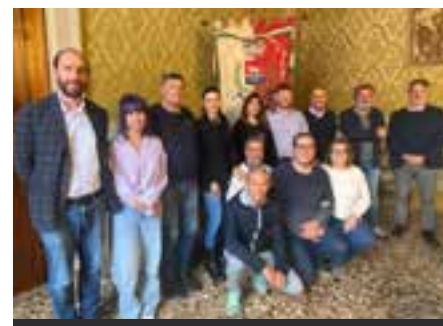
A Bagnacavallo con il Sindaco Matteo Giacomoni e la sua Giunta comunale