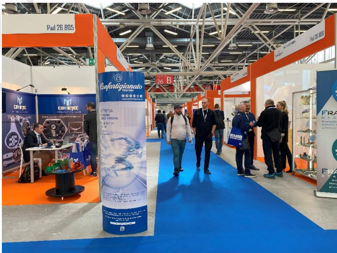
Il Villaggio Confartigianato dell'edizione 2023