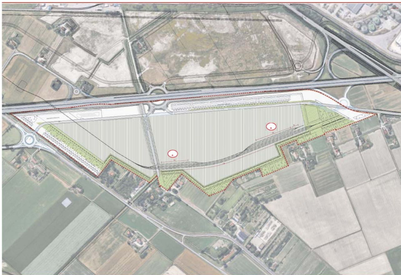
AdSP, Piattaforma Logistica Agroalimentare – Sistema degli Usi (Estratto)