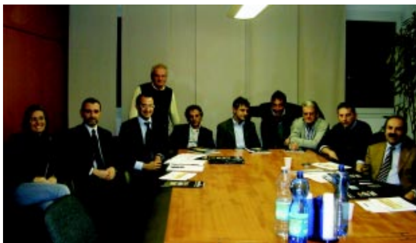
Un momento dell'incontro tra i tecnici di Centuria - Rit e gli imprenditori interessati svoltosi presso la Sede Confartigianato