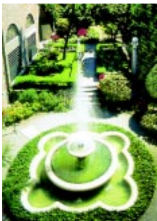
I giardini del Palazzo della Provincia