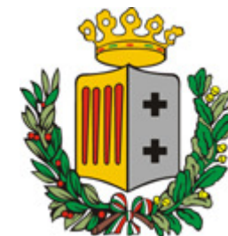
Provincia di Reggio Calabria