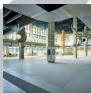
BUSINESS AREA MANUTENZIONI