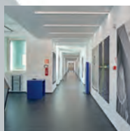
BUSINESS AREA SERVIZI