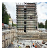
BUSINESS AREA PROGETTO 110

Progettazione, costruzione, manutenzione e ristrutturazione di edifici, strade ed opere complementari annesse, opere idrauliche a rete, impianti di trattamento acque, impianti tecnologici quali impianti idrico sanitari, impianti termici e di condizionamento, impianti elettrici, componenti strutturali