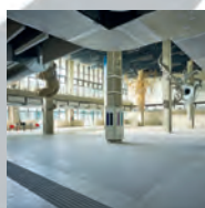
BUSINESS AREA MANUTENZIONI