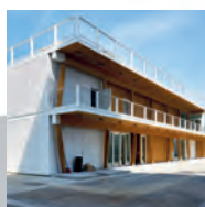
BUSINESS AREA LAVORI